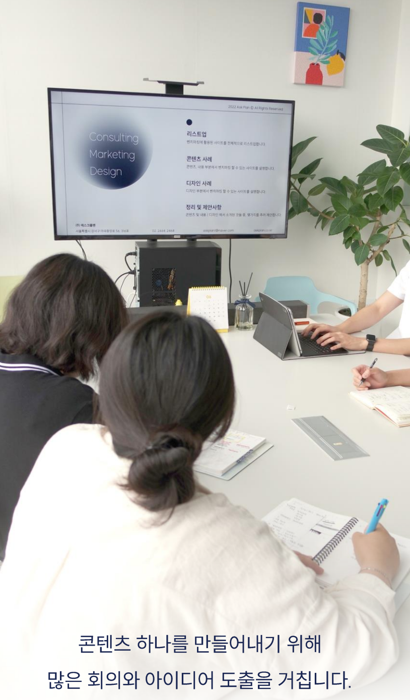
콘텐츠 하나를 만들어내기 위해 많은 회의와 아이디어 도출을 거칩니다.