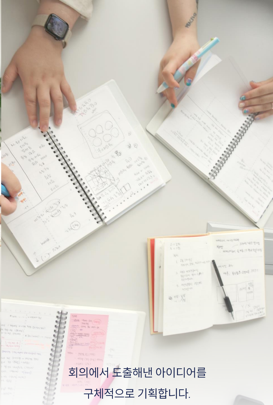
회의에서 도출해낸 아이디어를 구체적으로 기획합니다.