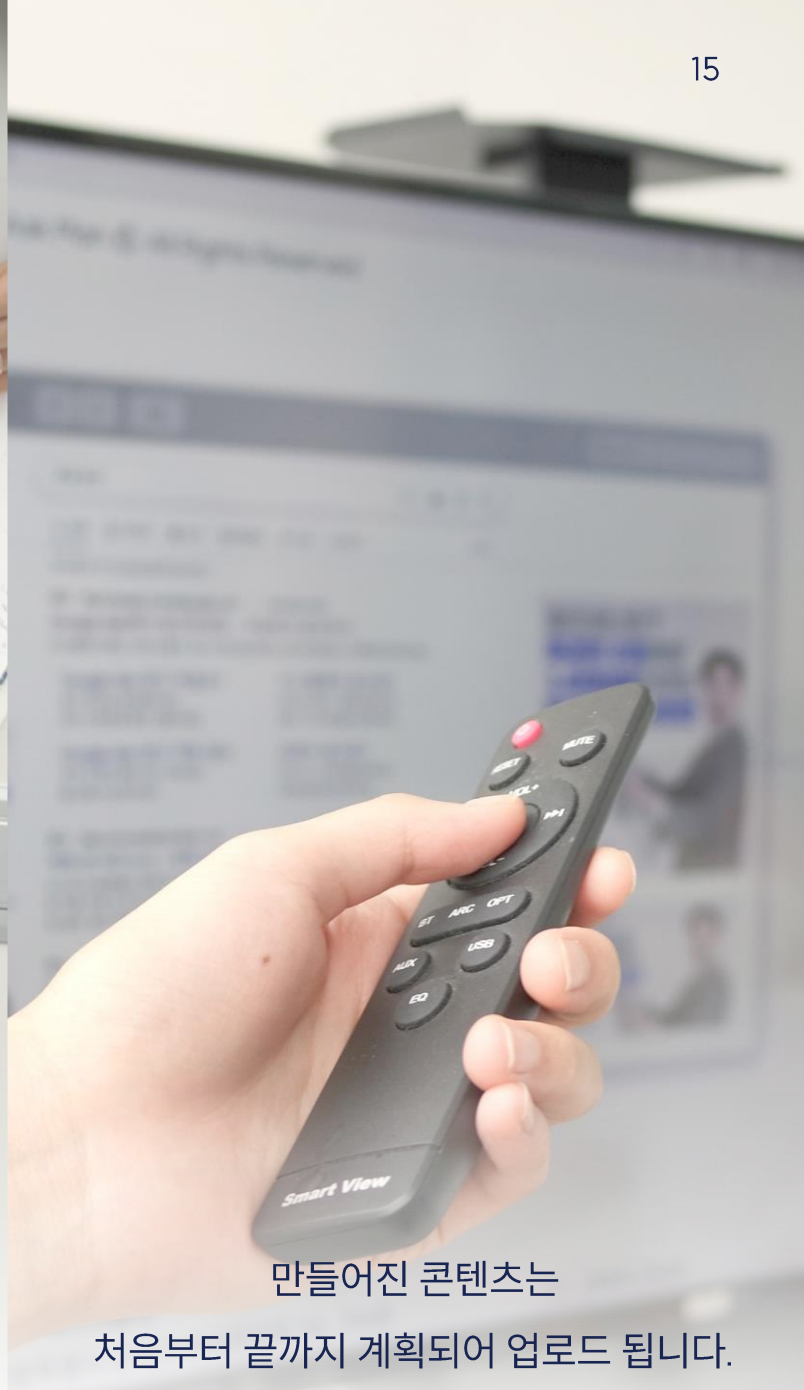
만들어진 콘텐츠는 처음부터 끝까지 계획되어 업로드 됩니다.